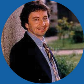
GS. CHRISTOPHE TAVERA

Phó chủ tịch Hội đồng khoa học Quốc gia các trường Đại học của Pháp Trưởng ban Kinh tế và Quản lý của Tổ chức Đại học Pháp ngữ (AFU)