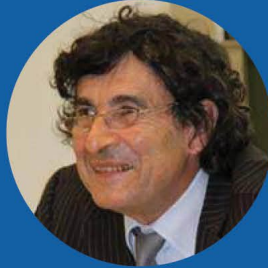
GS. JEAN-JACQUES DURAND

Phó chủ tịch Hội đồng khoa học Quốc gia các trường Đại học của Pháp Trưởng ban Kinh tế và Quản lý của Tổ chức Đại học Pháp ngữ (AFU)